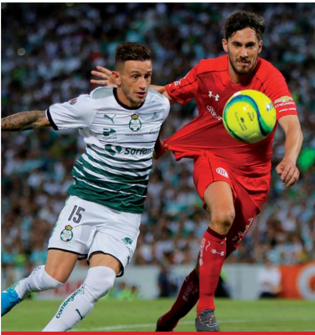
Definición. Diablos y Santos se disputan la gloria en el infierno.